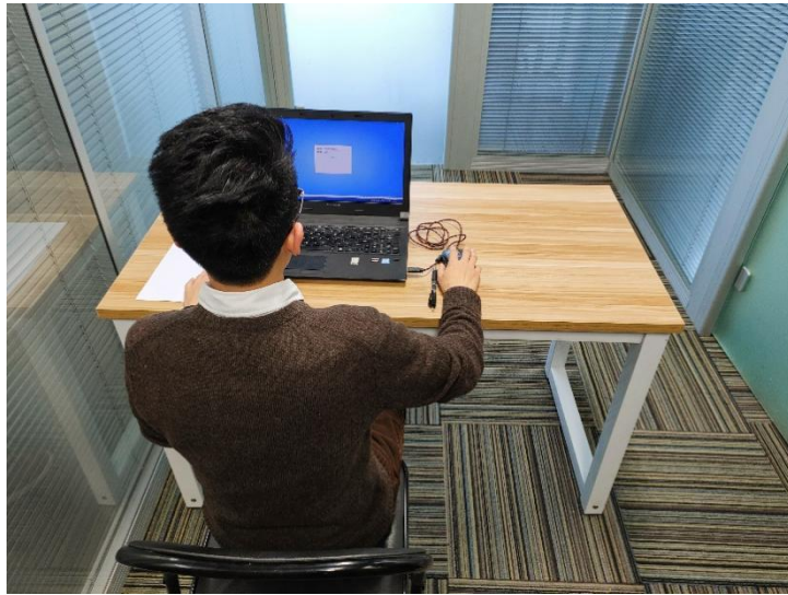
图二：电脑端背面视角